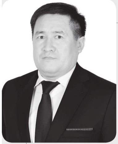
Ерлан КОСТУБАЕВ, председатель Риддерского городского суда Восточно- Казахстанской области