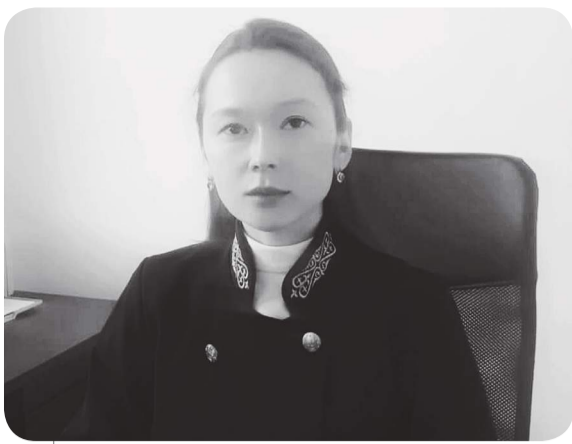
Айым ТЕМИРОВА, судья Межрайонного суда города Аксу Павлодарской области