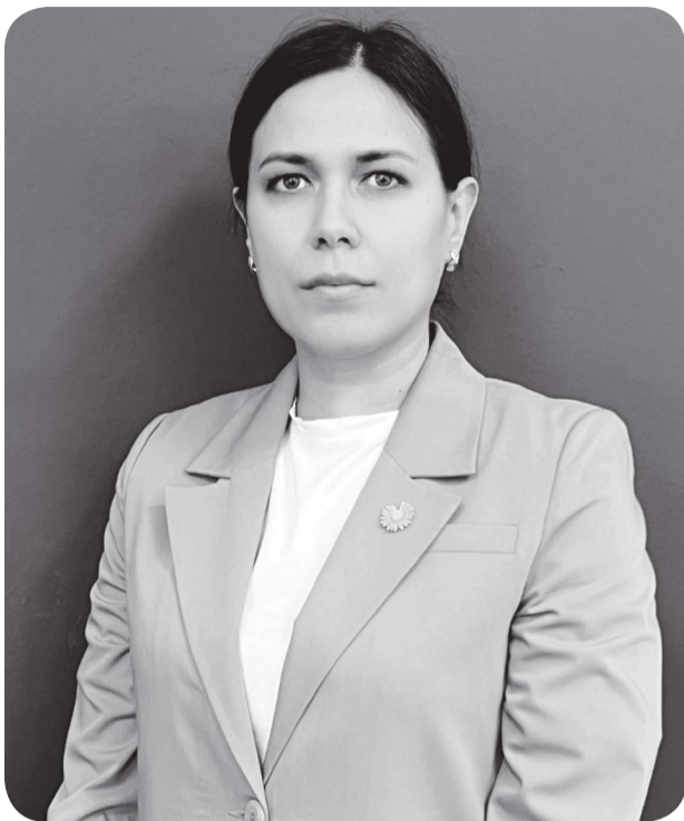
Евгения ТАНЦЕВА, судья Специализированного межрайонного административного суда Карагандинской области