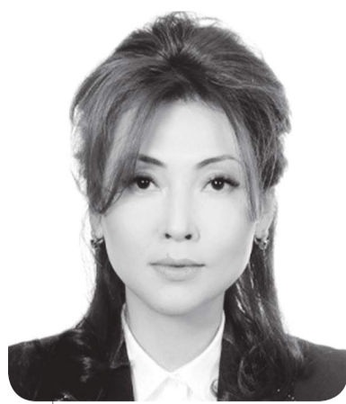
Алия МЕНЛИБАЕВА, судья Специализированного межрайонного административного суда г. Алматы