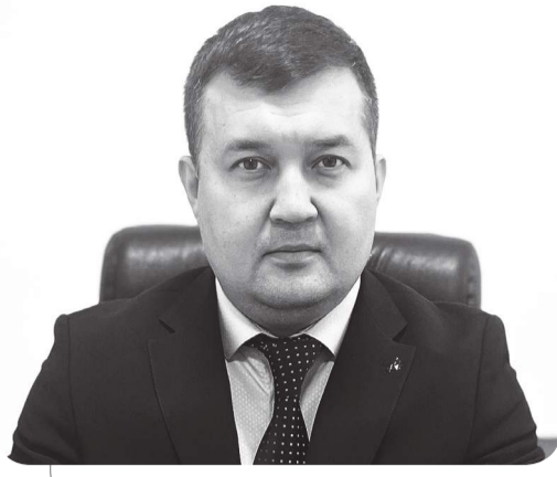
Габит АХМЕТОВ, судья Межрайонного суда по уголовным делам города Павлодара