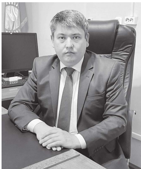
Сәкен СӘДУАҚАС, Шарбақты аудандық сотының төрағасы

Аталған заң қылмыстық-құқықтық саланы жетілдіру, азаматтардың құқықтары мен қауіпсіздігін қорғау мақсатында қабылданды. Заң 16 қыркүйектен бастап күшіне енді.