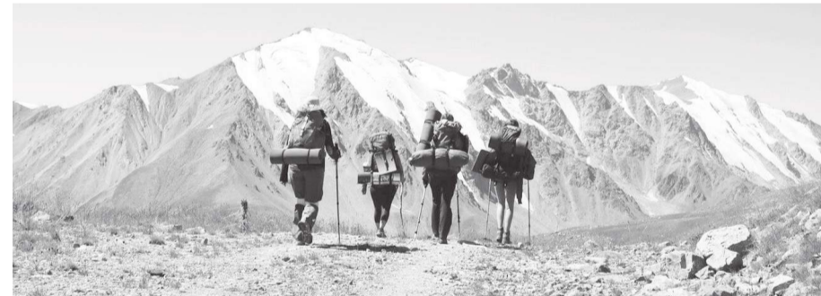
Е. БЕБЕКБАЙ, «Заң газеті»

Алматыны қазіргі таңда күллі дүниежүзі Орталық Азияның ең ірі қаржы және іскерлік орталығы ретінде таниды. Қала соңғы жылдары аймақтағы медицина, білім, ғылым, мәдениет, спорт салаларының дамуы бойынша да көшбасшылық тізгінді қолына берік ұстауда.