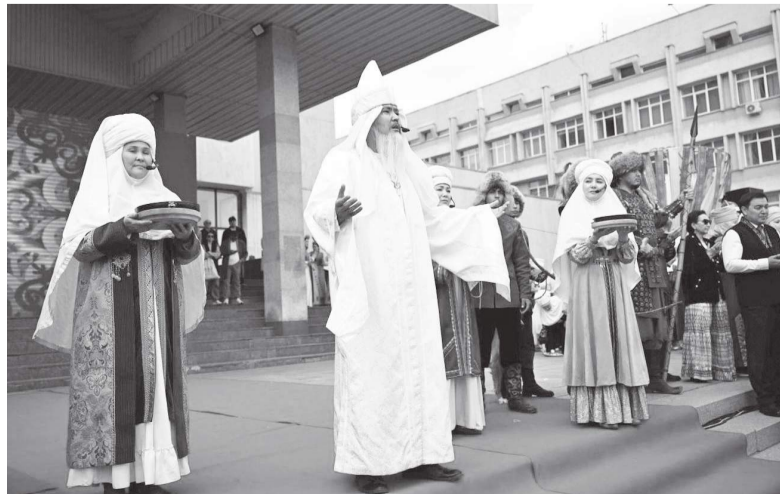
Әл-Фараби атындағы ҚазҰУ Баспасөз қызметі

Қонақтар этноауылды аралау барысында тұсаукесер, қыз ұзату және беташар сынды театрландырылған салт-дәстүрлерді тамашалап, мерекелік дастарқаннан дәм татты.