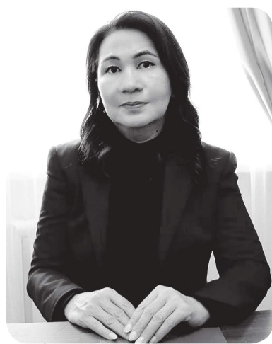
Анар МАМАНОВА, судья Акмолинского областного суда