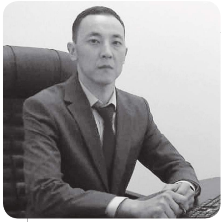
Арман ЖАКУПОВ, судья Специализированного следственного суда города Кокшетау Акмолинской области