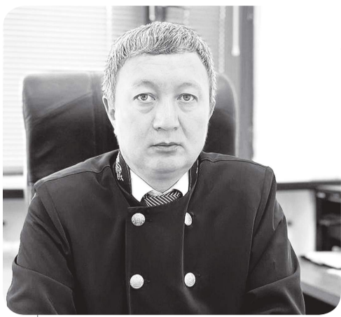
Ардак НАЗАРОВ, судья Специализированного межрайонного административного суда Карагандинской области