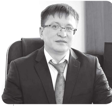
Канат АМИРАЛИН, судья Специализированного межрайонного административного суда Карагандинской области

Так, наделенные властными полномочиями налоговые органы, имея целый арсенал инструментов налогового администрирования, проводят различные виды контроля, по результатам которого выставляют уведомления в адрес налогоплательщиков, в которых, как правило, указаны нарушения налогового законодательства, и, если это камеральный контроль – то дается возможность исправить нарушения, если другие виды контроля – то уже начисляются конкретные суммы налогов, пени, либо иных платежей.