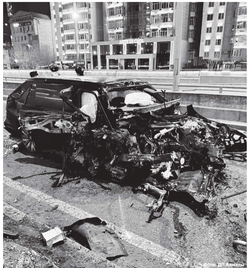
Фото: ДТП Алматы