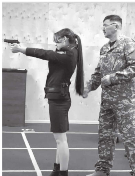
қоюдың айырмашылығы бар екенін де айтып өтті.

Республикалық базаға тіркеу оңай шаруа емес. Себебі, тіркеуге алынған адамның жеке басын растайтын құжатын немесе базаға қою тәртібін дұрыс таңдамаған жағдайда, база қабылдамайды. Сондықтан да компьютердің алдында отырып әрбір адамның құжатын тексеріп оны базаға тіркеу инемен құдық қазғандай. Сонымен қатар, Сара іздеушілер, қорғау нұсқама және ерекше талап бойынша тіркелген адамдарды есепке