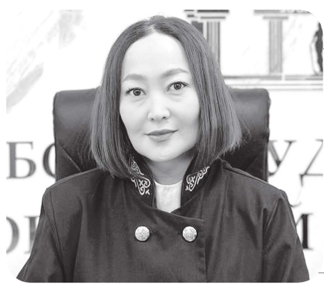
Марал ШАЙХМЕТОВА, судья Глубоковского районного суда Восточно-Казахстанской области