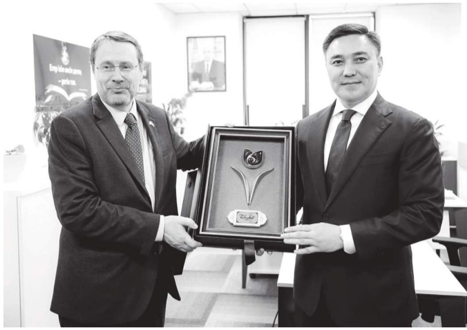
Торжественная церемония открытия Почетного консульства Королевства Бельгии состоялась в городе Шымкенте.

Новое дипломатическое представительство будет осуществлять деятельность не только в Шымкенте, но и охватит Туркестанскую, Кызылординскую и Жамбылскую области.