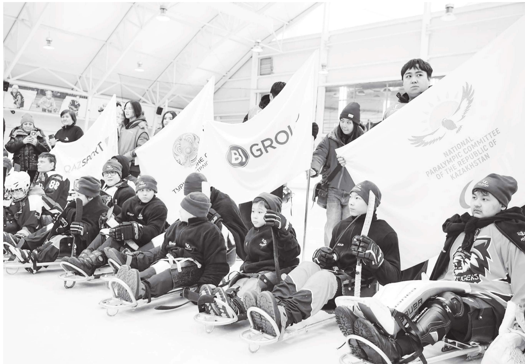
26–27 ақпан күндері Астана қаласында еліміздегі теңдесі жоқ жоба – Ұлттық инклюзивті «Жұлдызай» ойындарының қысқы кезеңі өтуде. Бғылғы жарыс 136 бала мен жасөспірімді біріктіріп, спорт арқылы шектеуді емес, мүмкіндікті алға шығаруды мақсат етті.