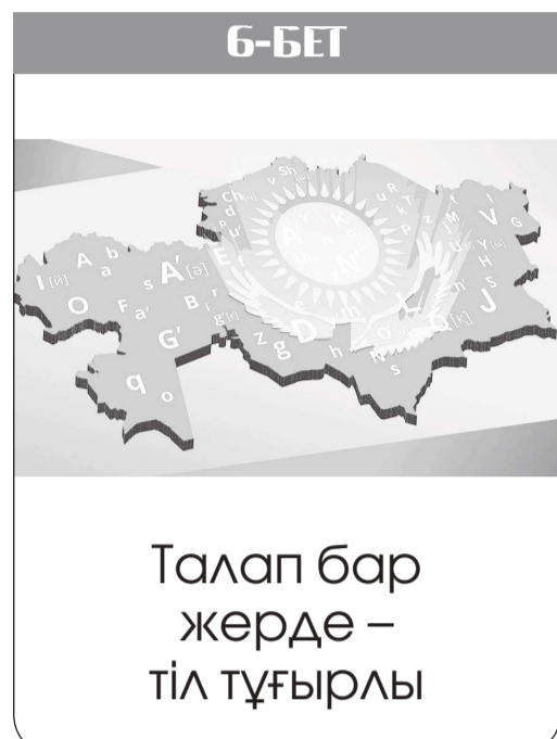
Талап бар жерде – тіл тұғырлы