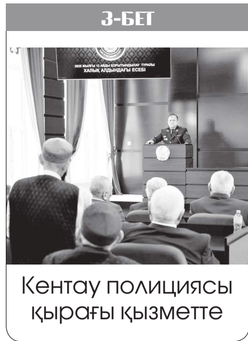
Кентау полициясы қырағы қызметте