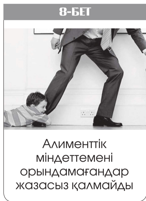
Алименттік міндеттемені орындамағандар жазасыз қалмайды