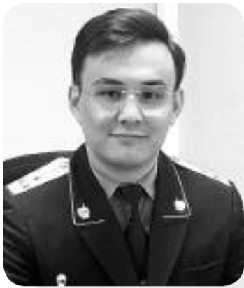
Фылымқожа АНУАРОВ, прокурор управления прокуратуры г. Астаны

НА СЕГОДНЯШНИЙ ДЕНЬ РАСПРОСТРАНЕНИЕ НАРКОТИЧЕСКИХ СРЕДСТВ ЯВЛЯЕТСЯ СЕРЬЕЗНОЙ УГРОЗОЙ ДЛЯ ОБЩЕСТВА, НЕСЕТ РАЗРУШИТЕЛЬНЫЕ ПОСЛЕДСТВИЯ ДЛЯ ЗДОРОВЬЯ, БЕЗОПАСНОСТИ И СТАБИЛЬНОСТИ. НАРКОТИКИ И ПСИХОТРОПНЫЕ ВЕЩЕСТВА СПОСОБНЫ РАЗРУШИТЬ ЖИЗНИ ЛЮДЕЙ И ИХ СЕМЬИ, ПОДОРВАТЬ СОЦИАЛЬНУЮ СТАБИЛЬНОСТЬ.