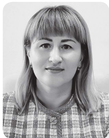
Инна КАРКАДА, судья Павлодарского областного суда

В демократическом правовом государстве формируются и находятся в постоянном развитии инструменты и институты, направленные на обеспечение защиты законных прав и интересов его граждан, а также общества в целом. В этом смысле неотъемлемой частью правового государства являются правоохранительные органы.