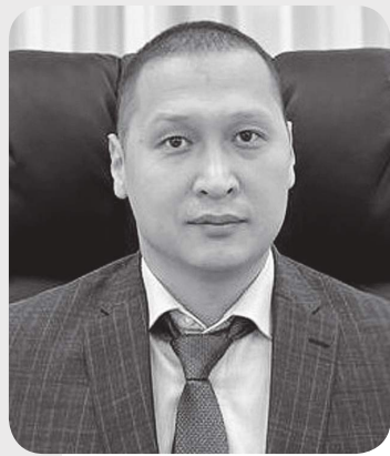
Дастан ИСМАИЛОВ, судья Специализированного межрайонного суда по уголовным делам г. Астаны