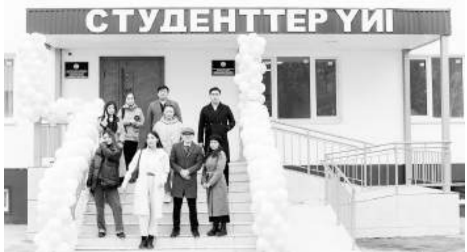
Бетті дайындаған А.АХМЕТОВА, «Заң газеті»

Айта кетейік, М.Өтемісов атындағы Батыс Қазақстан университетінде жаңа жатақхананы қоса алғанда студенттерге 1526 орын жасақталды. Алдағы уақытта жергілікті кәсіпкерлерді тарта отырып, жаңа ғимараттардың құрылысы қолға алынбақ.