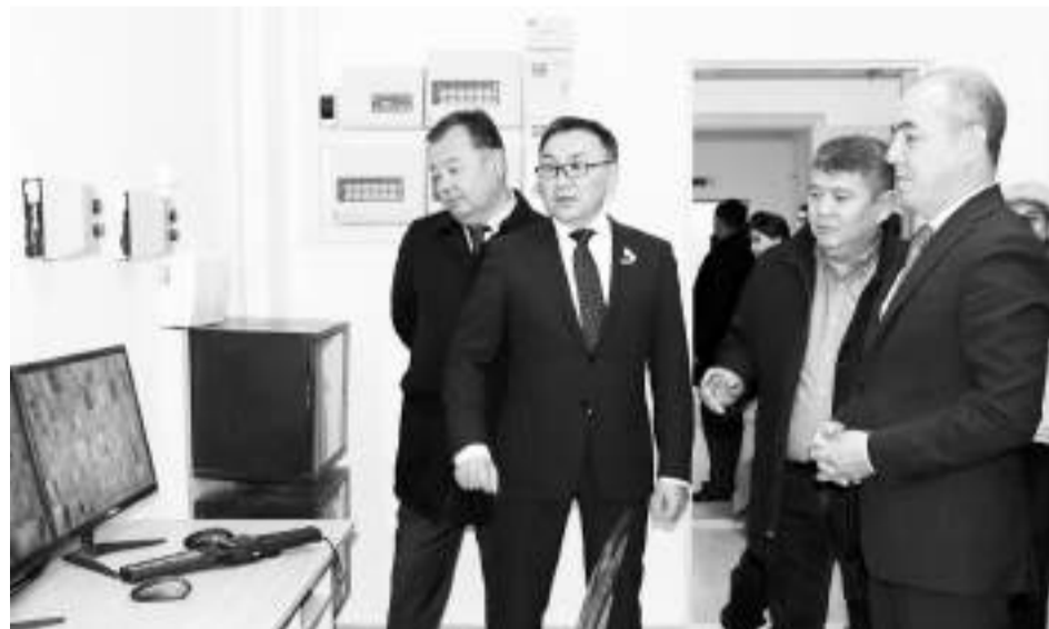
Республика күні қарсаңында Орал қаласындағы М.Өтемісов атындағы Батыс Қазақстан университетінде 500 орындық 9 қабатты жаңа жатақхана пайдалануға берілді.

Тарихи тереңде жатқан білім ордасының жаңадан бой көтерген «Студенттер үйінің» ашылу салтанатына орай ҚР Жоғары білім және ғылым министрі Саясат Нұрбек LED экран арқылы құттықтауын жолдады.