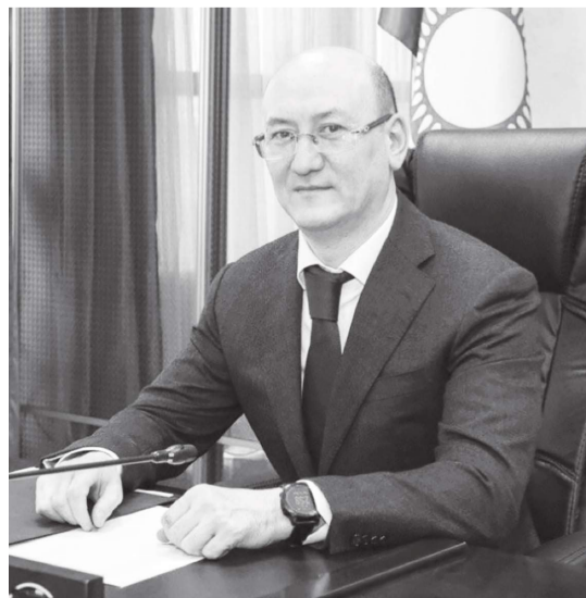
(Сұхбатты 5-беттен оқи аласыздар)