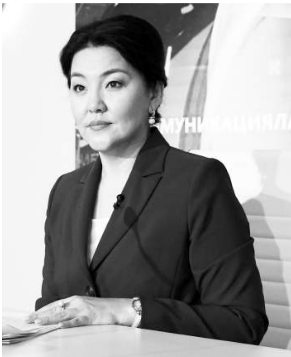
Ажар ФИНИЯТ, Денсаулық сақтау министрі

Сондай-ақ жедел жәрдем станциялары үйлестіруші ұйымға медициналық көмек көрсетуде интеграцияны қамтамасыз ететін медициналық ақпараттық жүйелерге қолжетімділікпен қамтамасыз етіледі. Ауылдық елді мекендердегі шақыруларға қызмет көрсету үшін