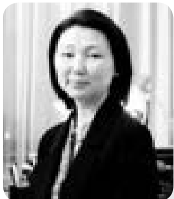
Рауна САГЫНДЫКОВА, судья Специализированного межрайонного административного суда Карагандинской области

Одной из категорий дел, по которой граждане часто обращаются в суд с исками о защите нарушенных прав, являются споры по делам в сфере архитектурной, строительной и градостроительной деятельности.