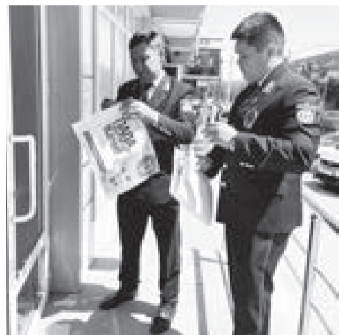
көзге түсетін жерлеріне ілінді. Бұл әкелік борышын ұмытып жүрген азаматтарға ой салады деген үміттеміз.

Алименттен қашып жүрген азаматтарға ой салып, санасына қозғау салу мақсатында жақында ауқымды шараны қолға алдық. Ол үшін «Алимент төлеу – ардың ісі», «Әке, алиментті ұмытпа!», «Әке, біз сізден алимент күтіп жүрміз!» деген мағынадағы биллборд, плакаттар әзірленіп Алматы облысы Қарасай ауданының орталығы – Қаскелеңдегі адам көп жүретін базар, вокзал, Халыққа қызмет көрсету орталығы, емхана, аурухананың бірден