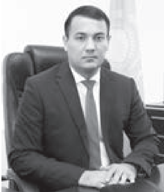
Телжан ЖҮСІПОВ, Байқоңыр қалалық сотының төрағасы

Судья болу терең білім мен алғырлықты, кемеңгерлікті жауапкершілік пен төзімді талап етеді. Себебі, ол адамдардың тағдырын шешеді, даулар туғызатын істерді қарайды. Қай санаттағы істер болмасын судья тараптарға бірдей көзқараспен қарап, істі заң шеңберінде шешеді.