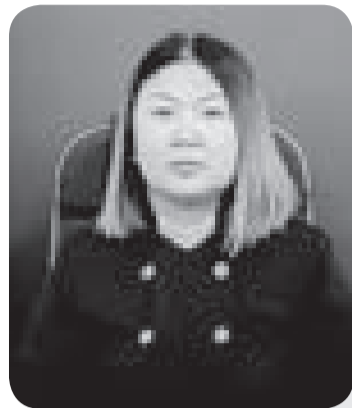
Динара АТЫМТАЕВА, судья Специализированного межрайонного административного суда Карагандинской области

Значительное количество исков связано с оспариванием протокольных решений земельных комиссий по вопросу предоставления участков, находящихся в государственной собственности, для ведения крестьянского или фермерского хозяйства, сельскохозяйственного производства.