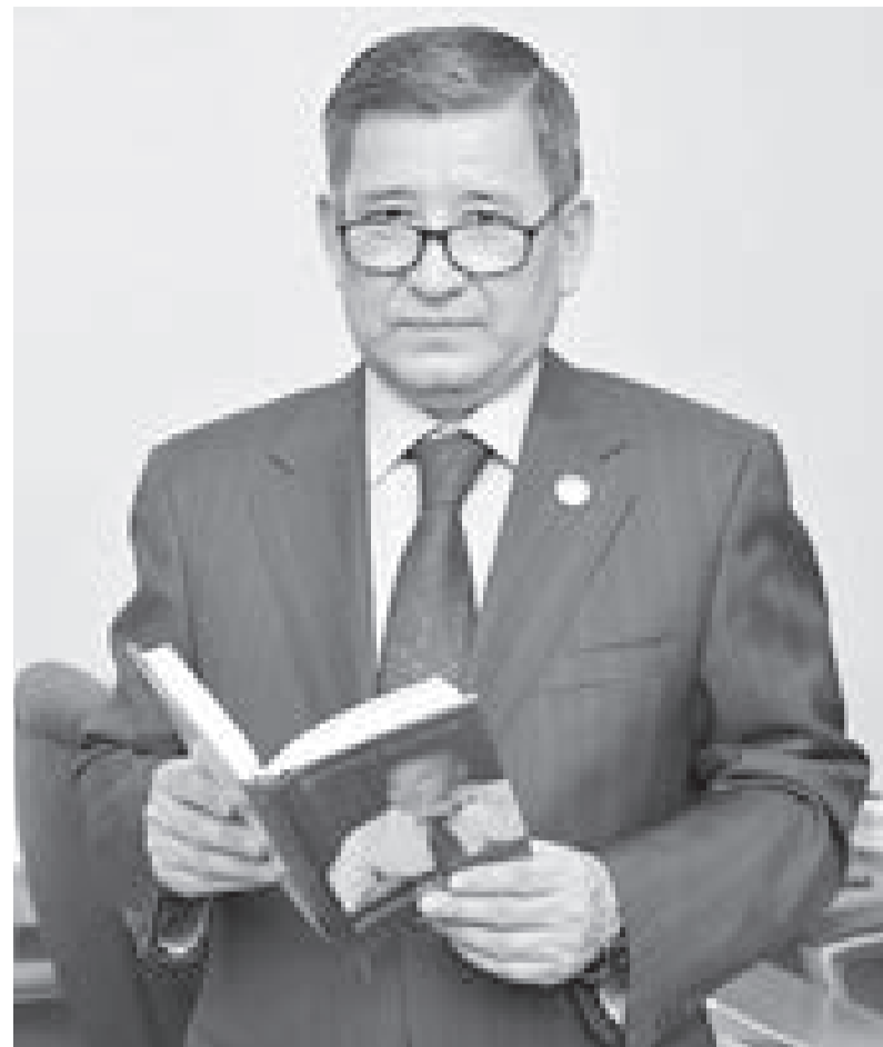
Бағлан МАҚҰЛБЕКОВ, Қазақстан Республикасы Жоғарғы Сотының доғарыстағы судьясы

автордың қалауы бойынша дайындалып, бірізділік, жоспарлау сияқты талаптарға сай келмегендіктен, пайдалануға жарамсыз болып қалды.