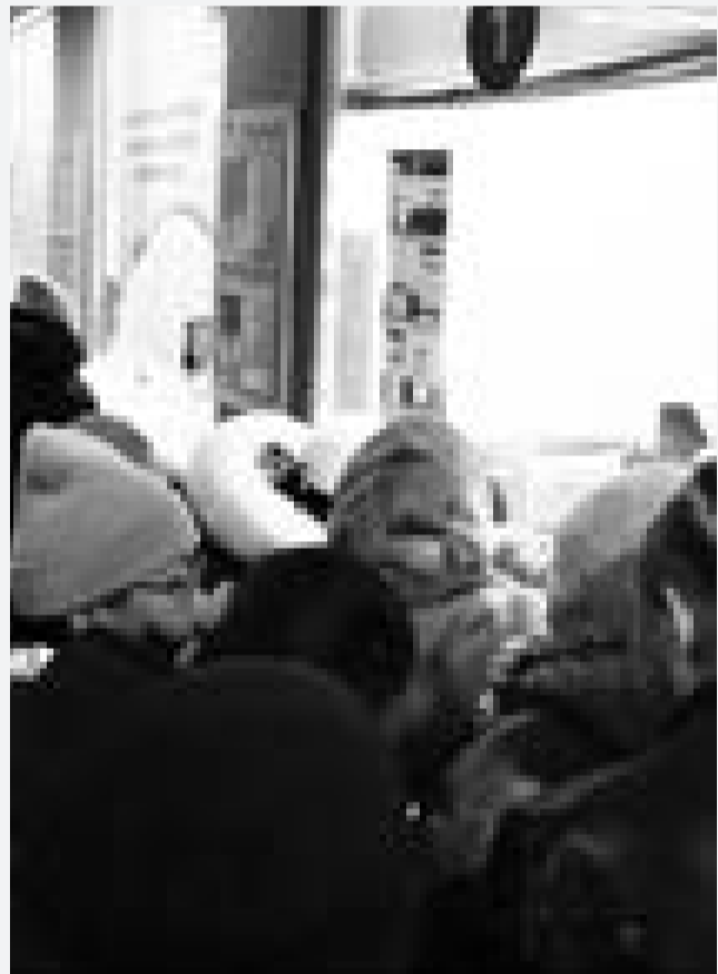
Пассажиры, стоящие в очереди у кассы №1 на вокзале г. Уральска после тщательных шести часов ожидания.

Отдельная тема – наши железнодорожные вокзалы, состояние которых оставляет желать лучшего. Я просто окончил, сидя на железнодорожном вокзале Актобе. Немного поднял шум, на который пришел начальник вокзала. Он, конечно, посетовал, что мой поезд опаздывает, но тоже ничего не мог с этим поделать. Насчет холода на вокзале только пообещал принять меры. Ну, хоть что-то... подумалось мне, не совсем безразличный человек оказался.