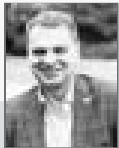
Роман ПОДОПРИГОРА , профессор, директор НИИ публичного права Каспийского университета, доктор юридических наук

Обратил внимание на то, что часто футболисты, вне зависимости от команды и вероисповедания, молились на футбольном поле. Молились и молились, что такого? Но я проецирую это на родное законодательство и правоприменительную практику.