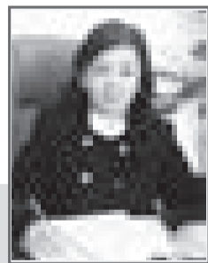
Сауле БАСКАНБАЕВА, судья Специализированного межрайонного экономического суда г. Алматы

Согласно законодательству нашей Республики, коррупция – это незаконное использование лицами, занимающими ответственную государственную должность, либо приравненными к ним, своих должностных (служебных) полномочий и связанных с ними возможностей для получения различных материальных благ, а также подкуп этих лиц.