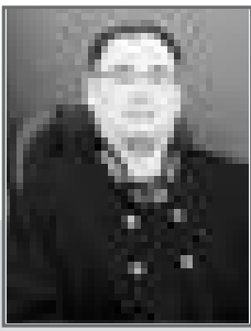
Даурен ДЮСЕНБАЕВ, судья Специализированного межрайонного административного суда Карагандинской области

Человек, его права и свободы являются высшей ценностью государства. Совершенно государство и его органы должны принимать все необходимые и достаточные меры по предоставлению равных возможностей каждому по реализации прав и свобод.