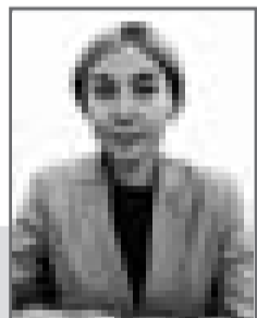
Бибинур КАЗТУГАНОВА, судья Специализированного межрайонного экономического суда Актыбинской области

ОСНОВНОЕ НАЗНАЧЕНИЕ СУДЕБНОЙ ВЛАСТИ СОСТОИТ В ЗАЩИТЕ ПРАВ, СВОБОД И ЗАКОННЫХ ИНТЕРЕСОВ ГРАЖДАН И ОРГАНИЗАЦИЙ, ОБЕСПЕЧЕНИИ ИСПОЛНЕНИЯ КОНСТИТУЦИИ И ЗАКОНОВ СТРАНЫ.