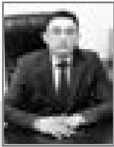
Нуржан ОМАРОВ, председатель Специализированного суда по административным правонарушениям г. Павлодара

Глава нашего государства особое внимание уделяет защите гражданских прав, механизм обеспечения которых претворяется, в частности, путем функционирования независимого и беспристрастного судебного органа.