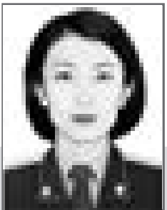
Айгуль КУСАИНОВА, прокурор Управления по поддержанию государственного обвинения и участию в апелляционной инстанции прокуратуры г. Астаны

Водители транспортных средств должны строго соблюдать Правила дорожного движения, утвержденные Постановлением Правительства Республики Казахстан от 13.11.2014 года №1196.