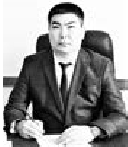
Канат МАКАЖАНОВ, председатель Специализированного межрайонного административного суда Карагандинской области

Общеизвестным является осуществление административного судопроизводства на основе активной роли суда. За год с небольшим действия Административного процедурно-процессуального кодекса Республики Казахстан (далее – АППК) сформировалась определенная практика применения этого принципа.