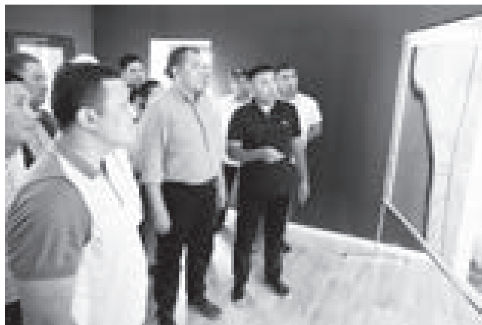
Маңғыстау облысының әкімі Нұрлан Ноғаев Түпқараған ауданына барып, жаңадан ашылған «Сартас» визит-орталығының жұмысымен танысты.

Жұмыс сапары аясында аймақ басшысы алдымен аудан аумағында орналасқан тарихи және мәдени ескерткіштер – «Кенті баба» қорымы,