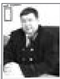
Ринат КУРМАНГАЛИЕВ, судья Акусского городского суда Павлодарской области

Согласно ст. 1 Закона РК «О медиации» сферой применения медиации являются споры (конфликты), возникающие из гражданских, трудовых, семейных, административных правоотношений и иных общественных отношений с участием