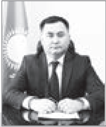
Асламбек МЕРГАЛИЕВ, председатель Актыубинского областного суда

Стремительно пролетели 12 месяцев. Исполнился год административной юстиции в Казахстане, год как внедрен Административный процессуальный кодекс и во всех регионах страны работают специализированные административные суды.