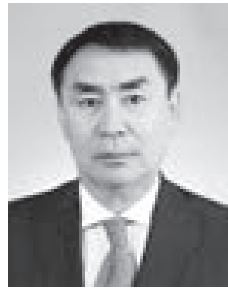
Манат КӨМІРШИНОВ, Шығыс Қазақстан облыстық сотының төрағасы