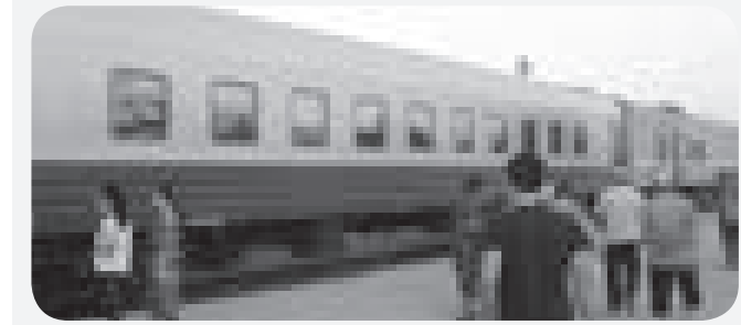
«Алматы 1» станциясы ЖІПБ баспасөз қызметі

Құқық бұзушылықты ескерту, жолын кесу маңызды. Әсіресе, қоғамдық орындарда ортақ тәртіпті сақтау бұлжымас міндет. Осыған орай «Алматы 1» станциясында қауіпсіздікті қамтамасыз ету мақсатында тиісті шаралар тұрақты қолға алынуда. Жақында Желілік полиция басқармасының мұрындық болуымен өткен «Көліктегі қауіпсіздік» акциясы сол ауқымды шараның бір парасы.