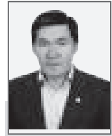
Оразалы САБДЕН, академик, президент Союза ученых Казахстана, лауреат Государственной премии РК

Известный казахстанский ученый Оразалы Сабден предлагает свое видение решения проблем развития страны, которое он направил Президенту РК К.-Ж. К. Токаеву, и предлагает обсудить общественности.