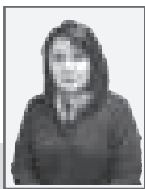
Каламкас ТЕМИРОВА, председатель Специализированного межрайонного суда по делам несовершеннолетних Павлодарской области

СПЕЦИАЛИЗИРОВАННЫЙ МЕЖРАЙОННЫЙ СУД ПО ДЕЛАМ НЕСОВЕРШЕННОЛЕТНИХ ПАВЛОДАРСКОЙ ОБЛАСТИ ОБРАЗОВАН УКАЗОМ ПРЕЗИДЕНТА РЕСПУБЛИКИ КАЗАХСТАН ОТ 4 ФЕВРАЛЯ 2012 ГОДА № 266.