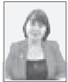
Софья АХМЕРОВА, судья Специализированного межрайонного административного суда ЗКО

В 2020 году процессуальное законодательство нашей страны претерпело значительные изменения. Главой государства был подписан Административный процедурно-процессуальный кодекс, который вступил в силу 1 июля 2021 года.