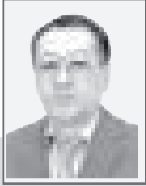
Бахытжан КАРАМАНОВ, председатель Павлодарского областного суда

В целях восстановления нарушенных в уголовном судопроизводстве прав личности, обеспечения единства судебной практики, правильного применения уголовного и уголовно-процессуального законов Законом Республики Казахстан от 27 декабря 2021 года «О внесении изменений и дополнений в некоторые законодательные акты Республики Казахстан по вопросам внедрения трехзвенной модели с разграничением полномочий и зон ответственности между правоохранительными органами, прокуратурой и судом» п. 7 ст. 443 УПК изложен в новой редакции: в случае отмены приговора с постановлением нового приговора в соответствии с ч. 1 ст. 441 настоящего Кодекса суд апелляционной инстанции, не вынося дополнительного постановления об отмене приговора, выносит апелляционный приговор по правилам главы 46 настоящего Кодекса, в котором указывает об отмене приговора суда первой инстанции.