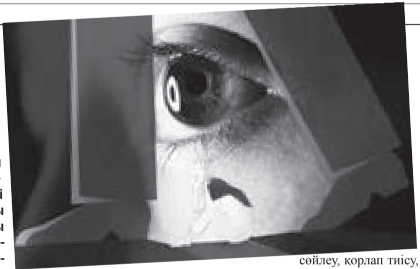
сөйлеу, қорлап тиісу,

Мемлекет үшін Мәр отбасының орны бөлек, маңызы жоғары. Себебі, үлкен мемлекеттің өзі шағын отбасылардан құралады. Отбасы құндылығының артып, ықпалының өсуі жақындар арасындағы жарасымдылықты сақтауға, қоғамға тәрбиелі, мәдениетті ұрпақ өкелуге септігін тиіргізеді. Бүгінгі таңда отбасы тыныштығын қорғау, тұрмыстық зорлық-зомбылықтың алдын алу бағытында елімізде атқарылып жатқан жұмыстар ауқымды.