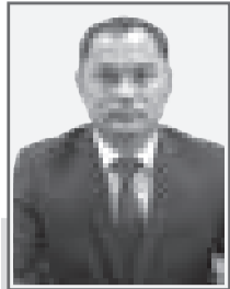
Ардак НУРГАЛИЕВ, председатель Специализированного следственного суда города Павлодара

Указом Президента Республики Казахстан от 10 января 2018 года в областных центрах и городах республиканского значения образованы специализированные и специализированные межрайонные следственные суды.