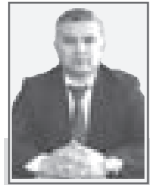
Асланбек ДЮСИНГАЛИЕВ , председатель Таскалинского районного суда Западно-Казахстанской области

С 1 июля этого года по всей Республике заработали вновь созданные административные суды, которые рассматривают дела, вытекающие из публично-правовых споров между физическими (юридическими) лицами и административными органами государств, согласно принципам и нормам, предусмотренным в Административном процессуально-процессуальном кодексе Республики Казахстан.