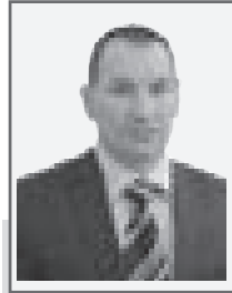
Раджаб ДАМИРОВ, председатель судебной коллегии по уголовным делам Акмолинского областного суда

Согласно п. 6 ст. 1 Закона РК «О противодействии коррупции», коррупция - это незаконное использование лицами, занимающими ответственную государственную должность, лицами, уполномоченными на выполнение государственных функций, лицами, приравненными к лицам, уполномоченным на выполнение государственных функций, должностными лицами своих должностных (служебных) полномочий и связанных с ними возможностей в целях получения или извлечения лично или через посредников имущественных (неимущественных) благ и преимуществ для себя либо третьих лиц, а равно подкуп данных лиц путем предоставления благ и преимуществ.