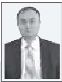
Сергей ВИКТОРЕНКО, председатель Специализированного межрайонного суда по уголовным делам Северо-Казахстанской области

В последние годы преступность в сфере незаконного оборота наркотических средств и психотропных веществ существенно трансформировалась и приобрела новые формы. В частности, широкое распространение получил сбыт наркотиков так называемым бесконтактным способом, исключающим возможность личного контакта продавца с покупателем.